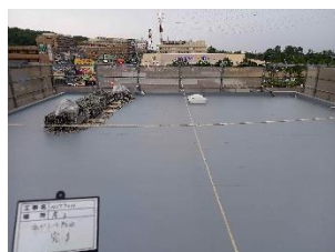
塩ビシート施工後