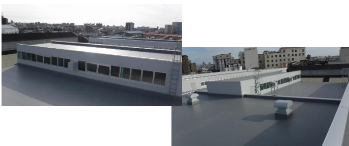
リニューアル工事で新築工場建屋の大型防水工事が完了