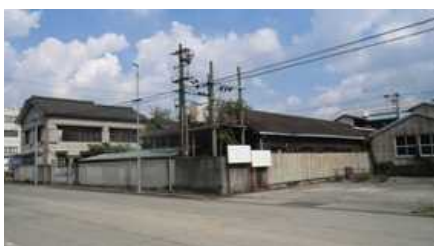
取得した土地の現況

現在の会社は、平成4年(1992年)1月から使用しています。その年の3月期の売上は、9億6500万でした。今、利用しているグループ会社も含めたすべての社屋(所有も賃貸も含めて)は、その後に取得しています。つまり、本社社屋が、当社内で最も長く利用しているということです。新築の建物なので、築25年で本社社員もきれいに清掃してくれており、内装の様式替えを行った箇所もあり、まだまだ利用可能で見た目にはさほど古さを感じてはいませんが、さすがに狭くなってきました。やはり、複数個所に分散するよりは、一つ場所でするのなら、その方がいい面でも便利で、コスト的にも効率的だと考えています。