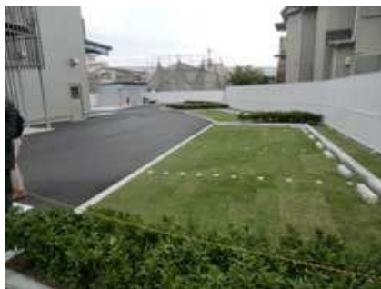
緑化された駐車場