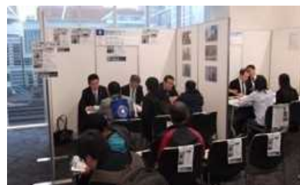
外国人向けの面接状況

求人活動で苦勞しているビルワークですが、10月29日に秋葉原のUDXで開催された日本に居住している外国人向けの求人フェアに参加しました。多くの求職者の方と面談をすることができ、今後、入社に向けた活動をしていきます。若い労働人口の減少は、まだまだこれからさらに進行していきます。何か活動をしていかないと活路を開くことはできないと、取り組んでいます。