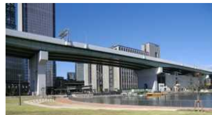
ささしまライブと水上バス