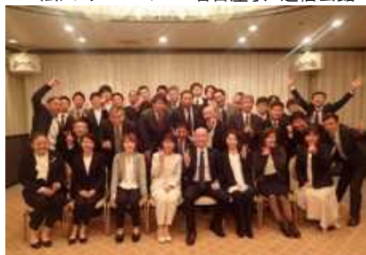
大阪事業部 懇親会