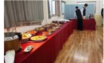
東京事業部 会議室での懇親会